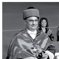
Francisco J. Mojica

Durant el curs 2017-2018 ha sigut investit Doctor Honoris Causa: